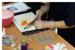
調理練習と実動作操作