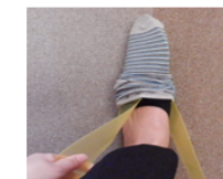
ソックスエイド作成